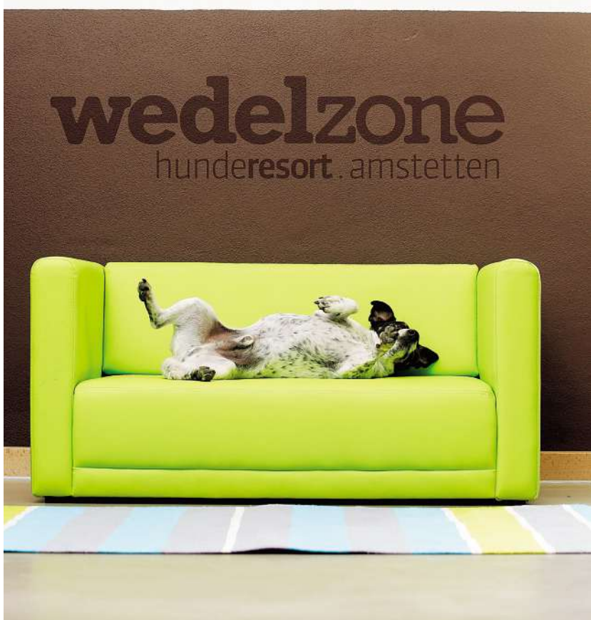
Im Hundehimmel I.: Rico beim Chillen (o.) auf einer der speziellen Hundecouchs. Hundehimmel II.: Finn und Noah (unten. re.) beim Herumtollen im riesigen Garten

hellen und freundlichen Zimmern könnte auch der Mensch angenehm urlauben. Einzig die Couchen in den Räumen sind etwas niedriger als die Ruheoasen fürs Herrl. Sogleich klärt die Hotelfeefin auf: „Das sind eigens gefertigte Hundecouchen mit Kunstlederbezug“. Nach der Abreise des Gasts sind sie leicht zu reinigen und zu sterilisieren. Auch